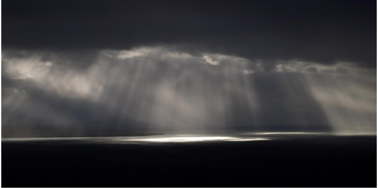
LAKE A PANORAMIC #9 Mardi 31 octobre 2023, 16h37 Tuesday, October 31, 2023, 4:37 pm

Tout est trop grand, décors et eau. Oskar Kokoschka 1886-1980